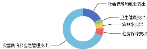
一般公共预算当年拨款结构图

2025年度大同市应急管理局一般公共预算当年支出2,233.22万元,主要用于以下方面:社会保障和就业支出375.99万元,占16.84%;卫生健康支出75.80万元,占3.39%;农林水支出100.00万元,占4.48%;住房保障支出134.03万元,占6.00%;灾害防治及应急管理支出1,547.40万元,占69.29%等。